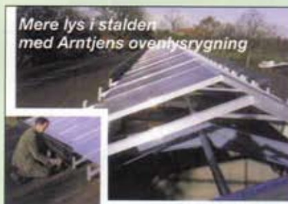
Mere lys i stalden med Arntjens ovenlysrygning