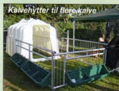
Kalvehytter til flere kalve