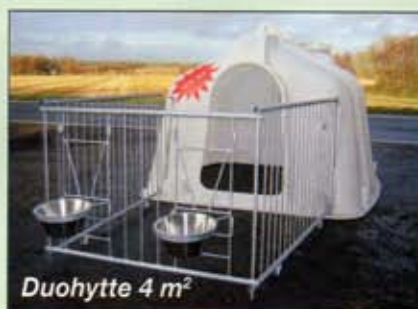
Duohytte 4 m 2